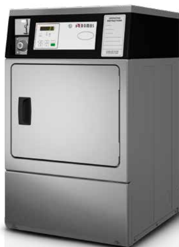
S-10 III INOX COIN