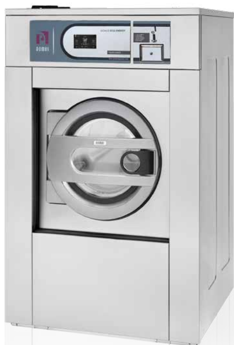
DHS-18 TOUCH COIN

La gamme livre-service se décline en différentes capacités selon modèles suspendus (d'11 à 36kg) ou à fixer au sol (d'11 à 27kg la gamme medium essorage et d'11 à 60kg modèles simple essorage), en facteur G 400, 200 ou 100, avec le même programmeur TOUCH CONTROL, et chauffage électrique ou eau chaude.