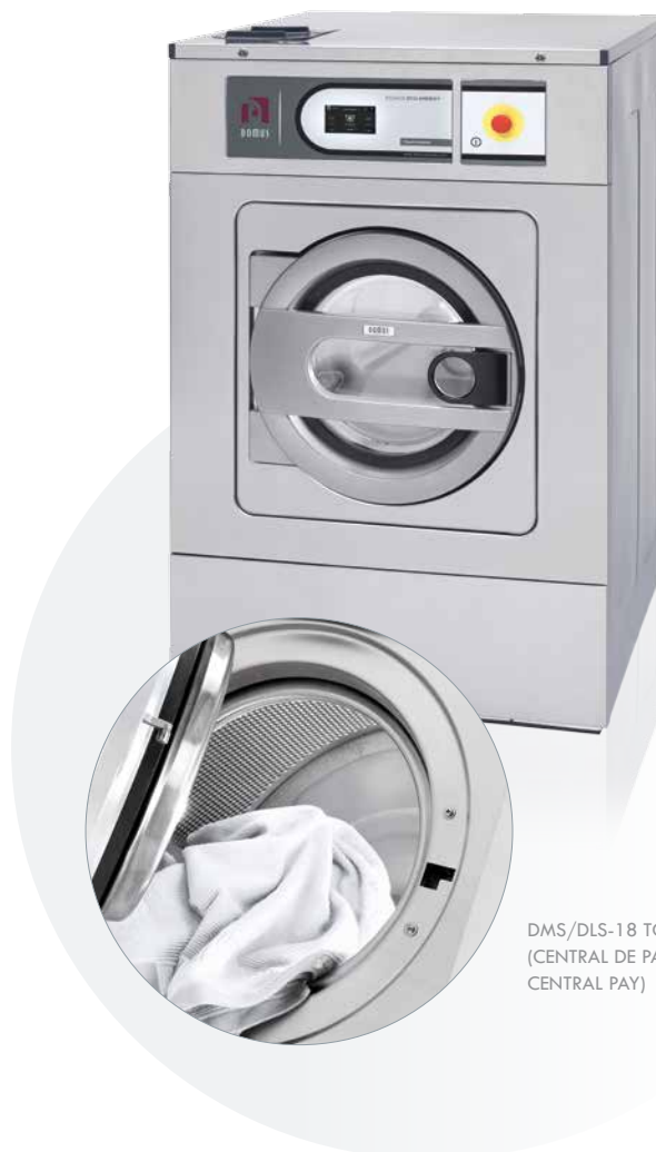
DMS/DLS-18 TOUCH (CENTRAL DE PAGO/ CENTRAL PAY)