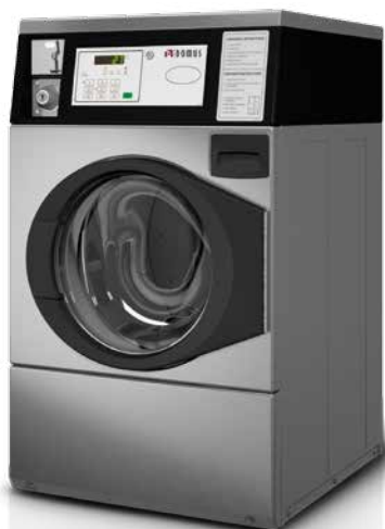
R-10 INOX COIN