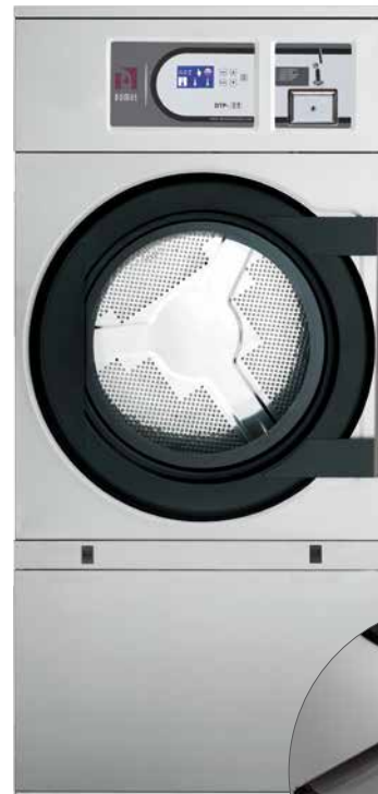
DTP-11 COMFORT COIN