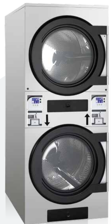
DTP2-11 STACK COIN